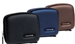
Draagtas en riem