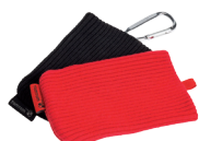
NIEUW - TomTom-hoesjes 2 pack